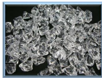
砕いて小さくすると・・・